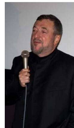
Павел Лунгин, режиссёр