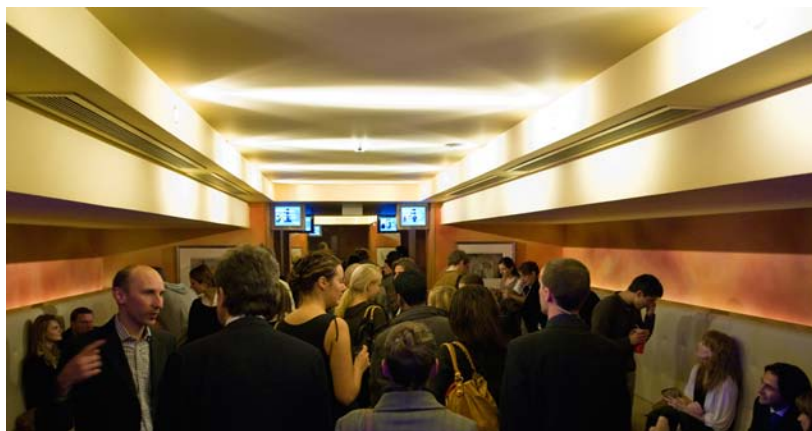
Открытие фестиваля в Apollo West End